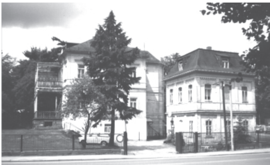
Das Obdachlosenheim in der Freiburger Beethovenstraße 11

Der Anspruch des Heimleiters und seiner vier Mitarbeiter, größtenteils ausgebildete Pädagogen, geht über die Bereitstellung einer "menschenwürdigen Übernachtungsmöglichkeit" hinaus: in der sogenannten Tagbetreuung wollen sie den Bewohnern bei der Lösung ihrer Probleme helfen - das heißt reden, reden und immer wieder reden. Mit Gläubigern, Arbeitgebern, Ämtern, Behörden und nicht zuletzt mit den Betroffenen selbst, die nicht immer bereit sind, sich bei ihren Schwierigkeiten helfen zu lassen. Höchstes Ziel ist die Reintegration der Obdachlosen in die Gesellschaft -