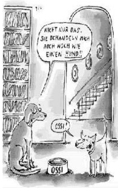
So sieht stern-Karikaturist Mette den Ossi...

Klaus Bittermann: „It's a Zoni - Zehn Jahre Wiedervereinigung - Die Ossis als Belastung und Belästigung“ Edition TIAMAT; Berlin 1999; ISBN: 3-89320-026-6