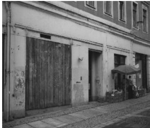
Die schönste und sauberste (Ex-)Plakatwand in Freiberg.