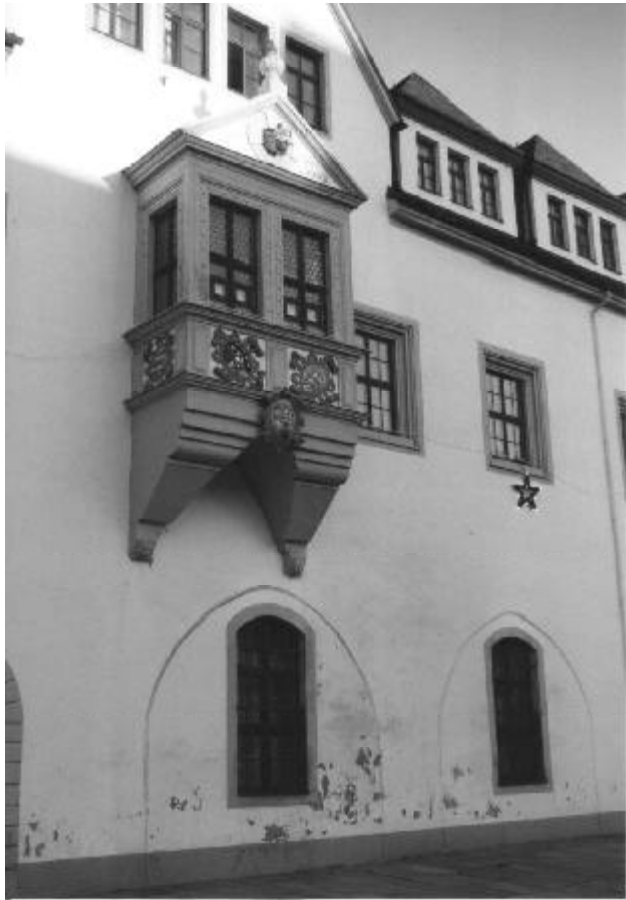
Das Rathaus mit der schönsten Bröckelfassade der Stadt...