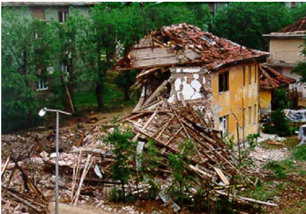
Zerstörungen in Valjevo, der nächstgrößeren Stadt von Mionica aus.

Kontonummer: 3115002768 Bankleitzahl: 87052000 Bank: Kreissparkasse Freiberg Kennwort: "Mionica" oder "Jugoslawien" bitte bei "Verwendungszweck" unbedingt angeben! Kontoinhaber: KJZ Freiberg e.V.