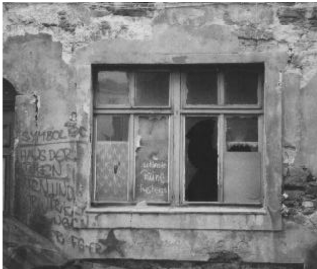
Die schönste Ruine der Stadt.

(se) Alle diese Fragen stellen sich in diesen Tagen Freiburger BürgerInnen. Auch im Stadtparlament erkundigten sich einige Mitglieder in der Januarsitzung verärgert nach der verwegenen Windfangkonstruktion im Eingangsbereich des Rathauses, worauf sich ein Gemurmel erhob und selbst der OB sein Unwohlsein nicht verbergen konnte. Daraufhin wurde die Sitzung unterbrochen und alle strebten zum locus delicti. Quaderförmig ausgerichtete stahlharte Träger, silbrig glänzend, zeigten sich den Zuschauern – sollte das vielleicht an die ruhmreiche silberschürfende Vergangenheit erinnern? Jetzt wird auch klar, warum der Denkmalschutz keine Einwände hatte... oder hatte man dieses Detail der Freiburger Rathausanierung mit dem Rat etwa nicht abgestimmt? Das wäre dann wohl die teuerste Version und man müßte alles wieder abreißen lassen, aber wir haben's ja und freuen uns auf die nächste Rathausaffäre!