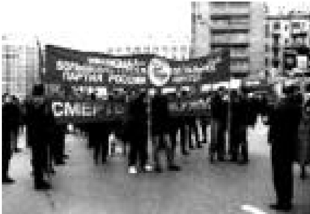
Nationalbolschewisten demonstrieren am 1. Mai in Moskau

April e n d - l i c h e n t - l a s s e n w u r d e ( d e r F a l l b e - s c h ä f - t i g t e d a s E u r o - p a p a r - l a - m e n t ). I n z w i - s c h e n w i r d e i n G e - s e t z ü b e r d e n