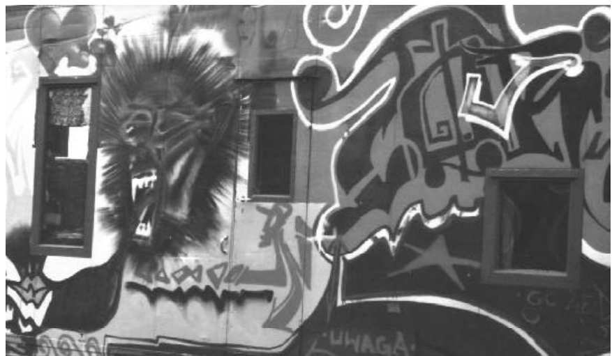
Kunst am Bau...wagen

Auflösung: FreibÄrger Nr. 27: Gewinnerin des Boggle- Spiels ist Suse ! Herzlichen Glückwunsch und weiterhin "gut boggle"!