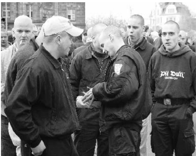
Freiberger Jungnazis folgten am 6. April einem Ruf des Neo-Nazis Christian Worch zum Aufmarsch in Leipzig

Die Bürgerinitiative "Kein Nazi-Zentrum in Gränitz und auch nicht anderswo!" ist zu erreichen: Külzstraße 10, 09618 Brand-Erbisdorf