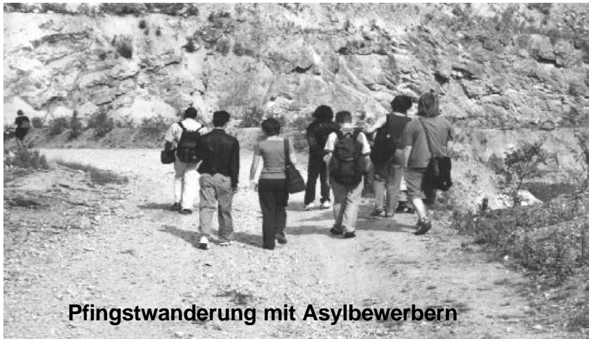
Pfingstwanderung mit Asylbewerbern

haupten wir natürlich nicht! Wir gehen ihn und seinen jeweiligen Zimmergefährten besuchen. Wir können nicht