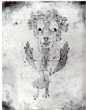
Paul Klee: Angelus novus (1910)

bekommen und nur eingeschränkt ihre Nahrung aufnehmen dürfen. Beginnt die Zerstörung der Vernunft schon im Rathaus von Freiberg, denke ich oft. Warum dürfen meine irani-