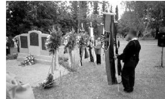
Neo-Nazi Kleber auf der JLO-Website unkenntlich aber in Freiberg gedenkend