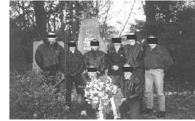
Neo-nazistische Selbstdarstellung: Norkus Bande mit Brett vorm Kopf