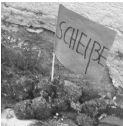
Ordnungsfanatiker markiert Hundehaufen am Freiburger Dom