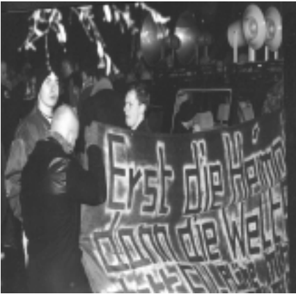
Früher hieß es noch "Heute Deutschland und morgen die ganze Welt"