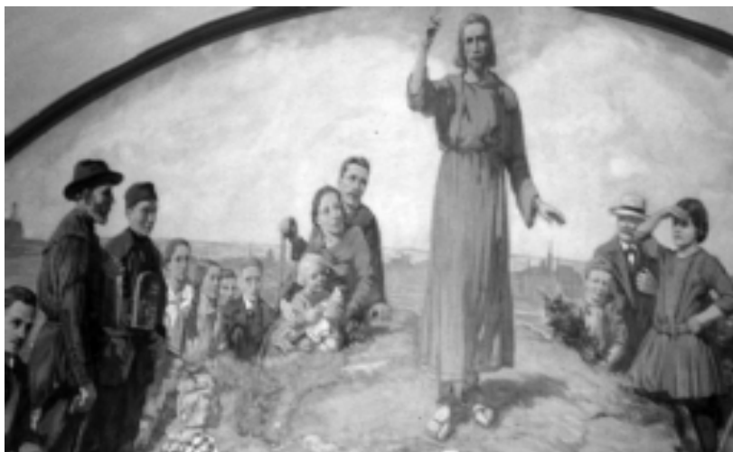
Ein Treffen der Ur-Tootsies, dokumentiert in der Nikolaikirche?

Song „wir sind wir“ von Paul van Dyk und dem „Wolfsheim“-Sänger Peter Heppner, die mit ihrer elektronischen Dusterhärte namens Trance einen Charterfolg hatten, waren seine Zweifel an der Integrität von Wolfsheim enorm angewachsen. Das Stück war ein Spagat zwischen „Loveparade“ und völkischen Landserheftchen. Tui-Tootsie fand bei aller unterschiedlicher Klangproduktion einen gemeinsamen Trend bei solchen KünstlerInnen: das unverkrampfte Ver-