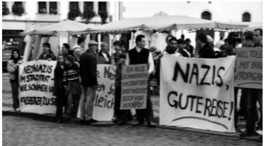
Protestaktion gegen NPD-Einzug in den Stadtrat von Freiberg.

Das Parteiprogramm der NPD für Sachsen zeigt deutliche Züge von Rassismus und Ausländerfeindlichkeit, aber auch für Jugendliche unpopuläre Forderungen wie dem nach einem generellen Rauchverbot an Schulen. Im Bereich Bildungspolitik fordert die NPD: „Die Überfremdung unseres Kultur- und Sprachschatzes durch Anglizismen muss gestoppt werden. ....Die Einführung von Englischunterricht in der Grundschule (oder gar Kindergarten) ist abzuschaffen. ... Abschaffung des Religionsunterrichts an staatlichen Schulen ... Ausländische Kinder ohne ausreichende Deutschkenntnisse dürfen nicht eingeschult werden. ... Abschaffung der Rechtsschreibereform. ... Pflichtfach „gesunde Ernährung“ an allen Schulen.“ Im Bereich Arbeit- und Wirtschaftspolitik stehen die Forderungen nach Ablehnung der Globalisierung, der Austritt aus der Europäischen Union sowie eine „Volks- und Raumnaher“-Wirtschaftskonzeption im Mittelpunkt. In seinem Kern ist das Programm