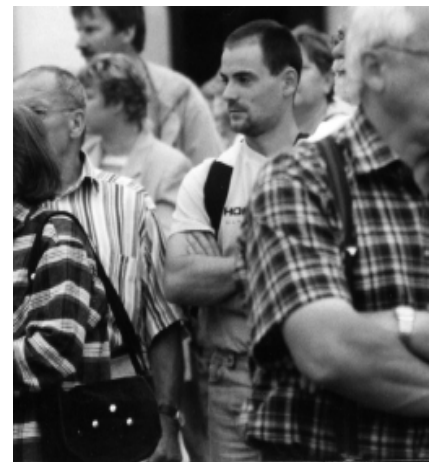
Sandro hat sich bei einer Anti-Hartz-Demo unter "Volk" gemischt, während seine "KameradInnen" ein Transparent hochhalten mussten "Klagt nicht, kämpft" (ein alter soldatischer Kampfruf).

dungen der Polizei glauben sind in der letzten Zeit einige Anschläge auf Objekte verübt worden, die Neonazis gehören oder betreiben. An dem Fakt, dass in den nächsten fünf Jahren Nazis ihre Propaganda mit Hilfe von Steuergeldern öffentlich verkünden können, ändert der jetzige Protest nichts. Er kam zu spät!