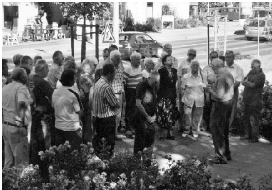
Thälmann-Gedenken am 18.08.2004

ge für die Würde des Menschen sei. Wohin uns aber diese Vergötterung des Volkstums in jüngerer Vergangenheit geführt hat, wissen wir. Genau am 18.08. vor 60 Jahren brachten die Nationalsozialisten den Antifaschisten und Kommunisten Ernst Thälmann um, wenige Tage später den Antifaschisten und Sozialdemokraten Breitscheid an gleicher Stelle, im KZ Buchenwald. Es ist für mich als Demokraten eine Schande, für mich als Sozialisten eine Schmach, dass auf den Tag genau 60 Jahre später im Freiburger Kreistag ein Anhänger der-