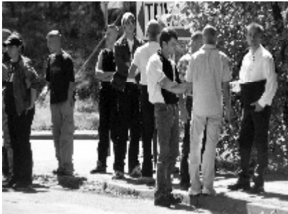
Kempe und seine Nazi-Riege vor dem Kreistag

Jugenddorfwerk Deutschland e.V. (CJD) Chemnitz, Gesellschaft für Bürgerrechte und Menschenwürde (GBM) Freiberg.