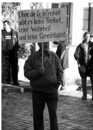
Bekannte Holocaust-Leugner wie David Irving, Germar Rudolf, Siegfried Verbeke und Ernst Zündel sind zur Zeit inhaftiert. Anlässlich des Prozessbeginns gegen Zündel demonstrierten tschechische Faschisten am 28. Oktober vor der Deutschen Botschaft in Prag für die Erlaubnis die Verbrechen an Juden zu leugnen.