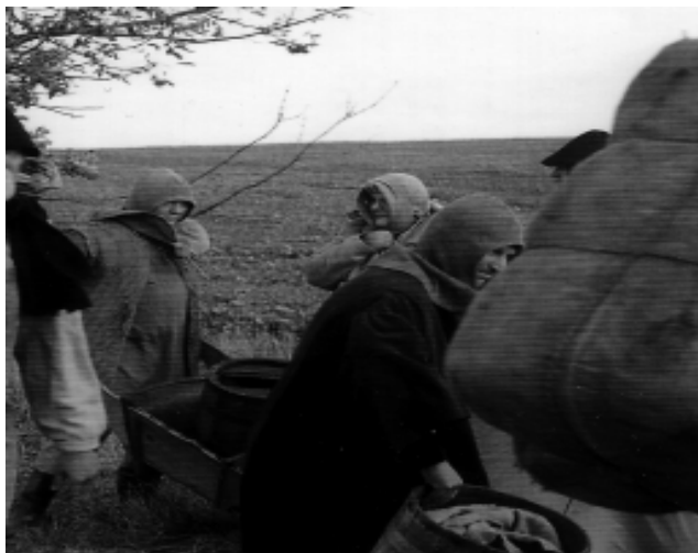
Übereinstimmungen mit realexistierenden Personen und tatsächlichen Begebenheiten sind rein zufällig und nicht beabsichtigt. H.P.

Mensch suche mindestens 4-buchstabile Wörter [nach oben keine Grenze]. Die Buchstaben müssen (benachbart) miteinander verbunden sein. Ein Buchstabe darf in einem Wort nicht zweimal benutzt werden. Eigennamen, geografische Begriffe, Abkürzungen - müssen leider draussen bleiben. Es geht alles, was im Rechtschreibduden gefunden wird. Wer die meisten Wörter-Punkte erzielt (4 Buchstaben- 1 Punkt, 5 Buchstaben- 2 Punkte, usw.), der/die erhält einen Gutschein für einen Brunch im Antik-Cafe in der Waisenhausstraße und darf einmal richtig gut schlemmen! Das Boggle aus Nr. 45 gewannen Silke Eppendorfer aus Brand-Erbisdorf und Steffen Richter aus Pirna. Herzlichen Glückwunsch, viel Spaß beim Brunch und allzeit "Gut Boggle!"