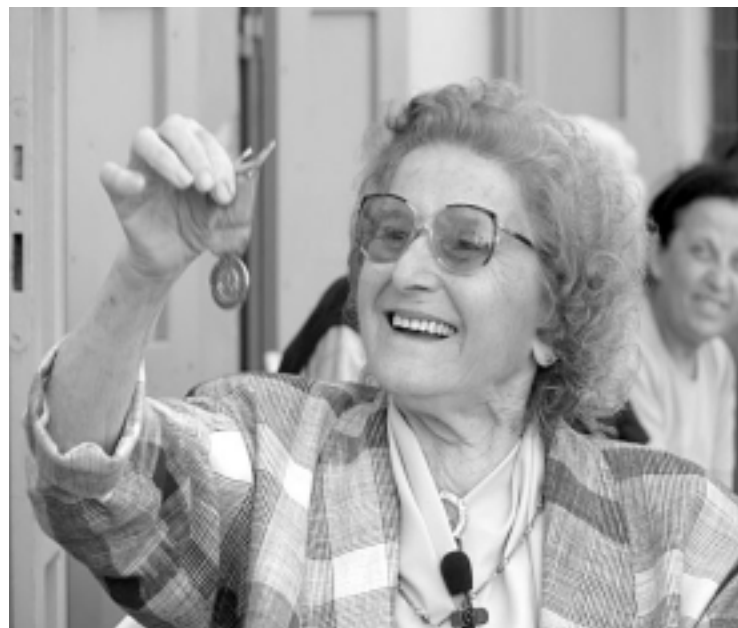
Auf den Spuren der PartisanInnen