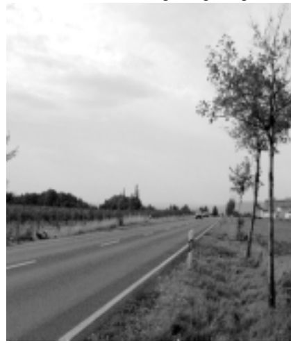
Die Unfallstelle an der B 172, kurz hinter der Ortsausfahrt von Pirna, aus Sicht des LKW-Fahrers.