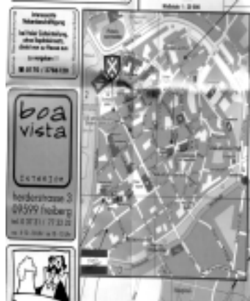
Im Stadtplan das Thor Steinar Logo

kaufen, auf dem "White Power" zu lesen ist oder die Insignien für "Heil Hitler" in Form des Zahlencodes "88". Sowiessen Sie Ihren Kindern keine Klammotten der Marke "ThorSteinar", schließlich findet ja in Ihrem Wohnzimmer kein Nazi-Aufmarsch statt, wie in Dresden am 13. Februar, der auch als Modeschau der Thor-Steinar Händler durchgehen könnte. Sie wundern sich, wer alles mit diesem Faltplan die Werbung für den Waffen-Army-Shoes unterstützt. Sie fragen gleich mal beim nächsten Einkauf oder Gaststättenbesuch nach bei: A.T.H. Roland Richter, Erbische Straße 2; Allianz-Versicherung, Bahnhofstr. 41; Andreas Pötzsch, Schulweg 13, Wegfarth; Anruf-Sammel-Taxi Stadt Freiberg; Antik-Cafe, Waisenhausstraße 7; Autohaus Winter, Häuersteig 29; Berger-Franken-stein Dienstleistungen, Bahnhofstraße 5; Boa vista, Herderstraße 3; CJD Chemnitz, Himmelfahrtsgasse 20; Cosmea, Dörnerzaunstraße 1; Dental Labor Herzog Gentsch; Der Tintenladen, Bahnhof 20;