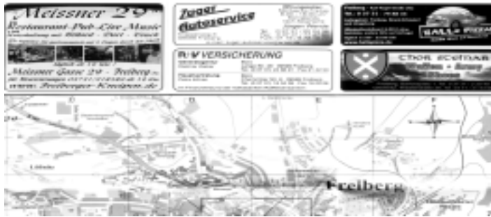
Werbung für Waffen und Nazikram