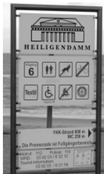
Die bürgerliche Welt scheint in bester Ordnung! Auf nach Heiligendamm zum FKK mit Angela!