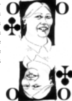
Ihr letzter Stich

pflegerin ein städtisches Bauwerk für die Jugend räumen lassen. Noch munkelt man in den Redaktionsstuben der "Freien Presse", man spricht dort vom Rathaus II, andere tuscheln über eine Umnutzung des Kornhauses.