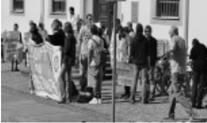
Netzwerk-Protest mit Trillerpfeifen, Transparenzen und einem eigens komponierten Solidaritätssong gegen die geplanten Abrisse vor der Ratssitzung am 3. Mai