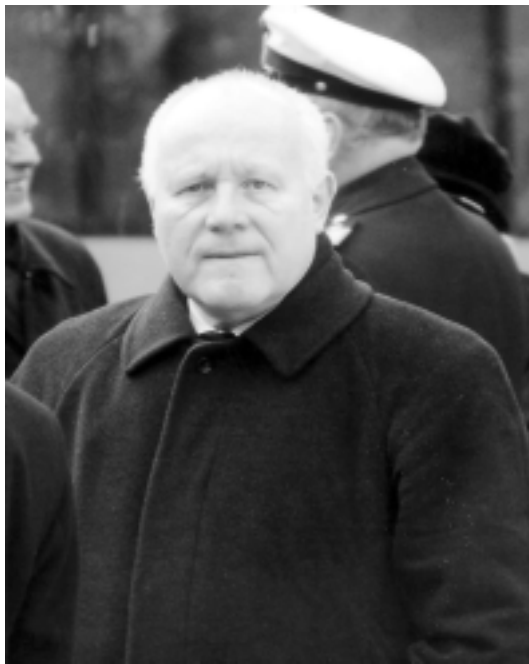
Ministerpräsident Georg Milbradt auf einer Trauerkundgebung anlässlich des antifaschistischen Angriffs auf die Stadt Dresden. Nicht weit entfernt von ihm ließ Nazi Holger Apfel sein Kränzchen nieder.

erheblichen Orientierungsproblemen und Sprachverwechslungen führten. "Milbradt habe nur zuviel Apfelkost serviert bekommen", vermeldete die Staatskanzlei. Überall, wo er in den letzten Wochen dienstlich zum Essen eingeladen war, servierte man ihm Apfelmus, Apfelstrudel, Apfelkonfitüren und gefüllte Gans'l mit Granatapfel. Deswegen, so die Staatskanzlei auf Nachfrage des Wirr-wahr-Teams, habe der Ministerpräsident die Fakten zum Mordversuch an indische Mitbürger aus Mügeln schlichtweg nicht mehr richtig einordnen können. In alter Revisionistenmanier und dem Nazi-Geplärre nicht unähnlich verwechselte der sächsische Landeschef mal wieder die Opfer mit den Tätern. Die Staatskanzlei ließ inzwischen den Ministerpräsidenten für seinen Unflath (sic!) entschuldigen. Die Wahrheit notierte einst der Philosoph Walter Benjamin, sei nicht wie ein Kristall, durch den mensch einfach durchschaue. Fürwahr!