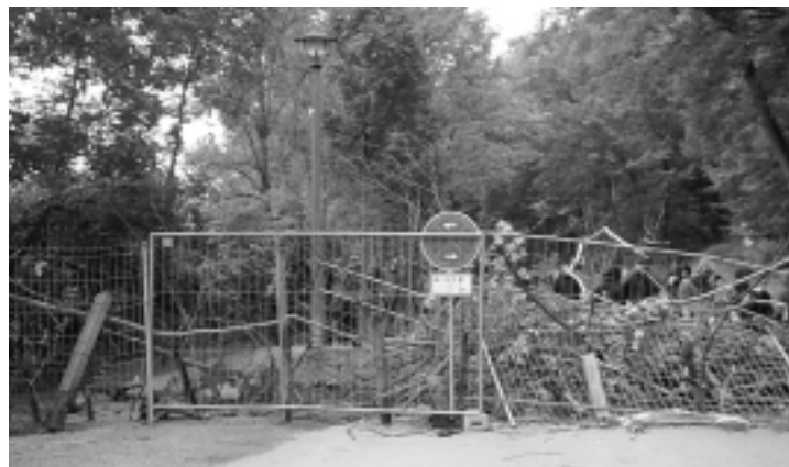
Auch phantasievolle Barrikaden konnten das Nazi-Spektakel nicht verhindern