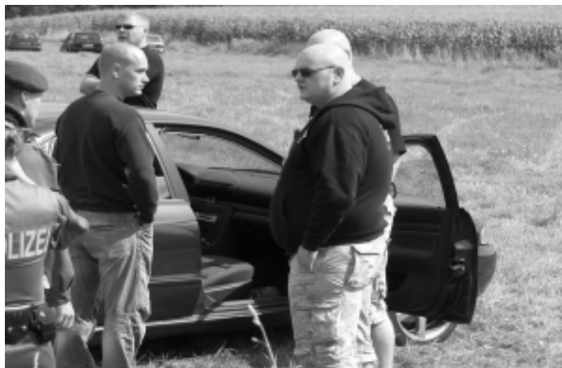
Eine Wagenladung von Jung-Nazis aus Freiberg wird von der Polizei kontrolliert.

und mussten gut 200 m vor dem Nazi-treffen stoppen, das auf dem Grundstück von Wolfgang Jürgens stattfand. Die Jung-Nazis litten unter dem Verbot des Alkoholkonsums auf dem Gelände. Fol-