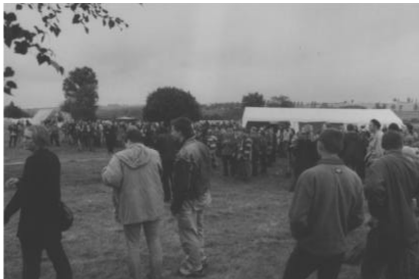
Flower Power in Freiberg

Veranstalter war - wie im letzten Jahr - der Freiburger Rock e.V. , der auch diesmal die Unterstützung der Sachsen Feuerwerk AG gewinnen konnte, die den Festplatz wieder kostenlos zur Verfügung stellte. Unangenehme Zwischenfälle gab es keine, was vielleicht u.a. der professionellen Ausstattung mit einem Zelt des DRK geschuldet ist.