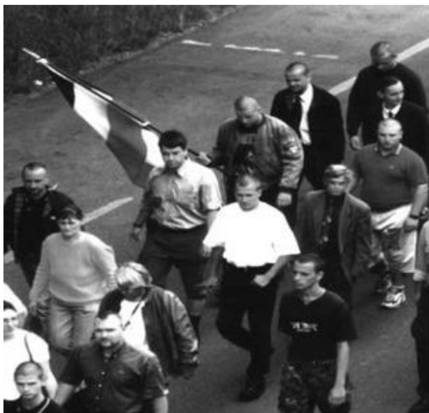
NPD-Marsch in Zittau 1.07.2000