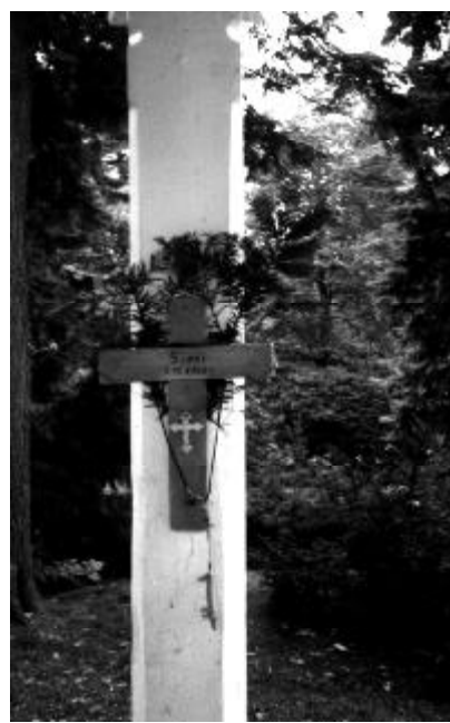
Bis vor kurzem noch zu sehen. Jetzt in den Gemäuern des Rathauses?