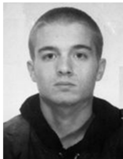
Carlo Giuliani von der Polizei auf der Demo in Genua erschossen