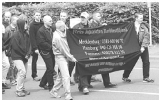
Neo-Nazi Aufmarsch in Zwickau im Juni

[ray] Die Anzahl rassistischer und rechtsradikaler deutscher Internet-Sei-